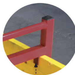
Maintien du panneau