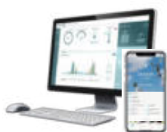
Suite logiciel MyLight Systems