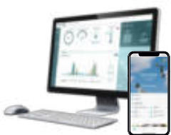
Suite logiciel MyLight Systems