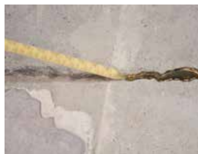
2 : Combler la fissure