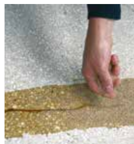
4 : Sabler à refus