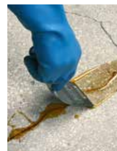
3 : Spatuler à zéro