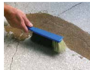
5 : Nettoyer le sable

Ce document technique peut faire l'objet de mise à jour, il est de la responsabilité de l'utilisateur de contrôler systématiquement si une version plus récente est disponible sur notre site www.cermix.com . Il est de la responsabilité de l'applicateur de contrôler la compatibilité et l'adéquation des produits pour la réalisation des travaux. Des essais peuvent être réalisés au préalable pour valider le bon comportement des produits.