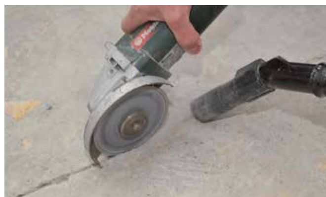
1 : Ouvrir la fissure