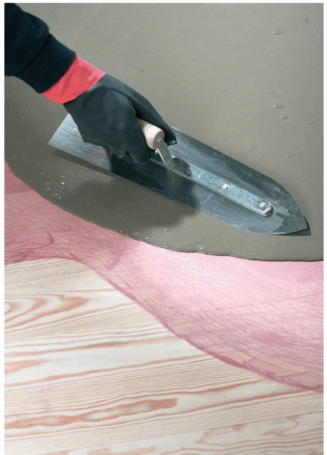
Associé au ragréage fibré RAGRENOV S30 ou RAGREFOR - pose sur bois

Ce document technique peut faire l'objet de mise à jour, il est de la responsabilité de l'utilisateur de contrôler systématiquement si une version plus récente est disponible sur notre site www.cermix.com . Il est de la responsabilité de l'applicateur de contrôler la compatibilité et l'adéquation des produits pour la réalisation des travaux. Des essais peuvent être réalisés au préalable pour valider le bon comportement des produits.