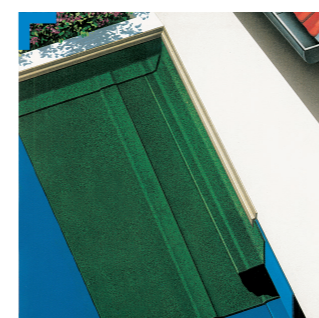
Étanchéité de terrasses non circulables : Colphène® 1500 + Colphène® 2090 AR

6 ÉTANCHEITÉ DURABLE Le bitume élastomère SBS utilisé dans la fabrication des membranes Colphène® garantit un haut niveau de fiabilité ainsi qu'une excellente résistance au vieillissement et, par conséquent, une protection durable de l'ouvrage.