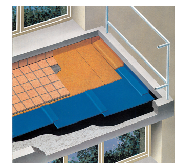
Étanchéité de balcons : Colphène® 1500 + Colphène® Cerader