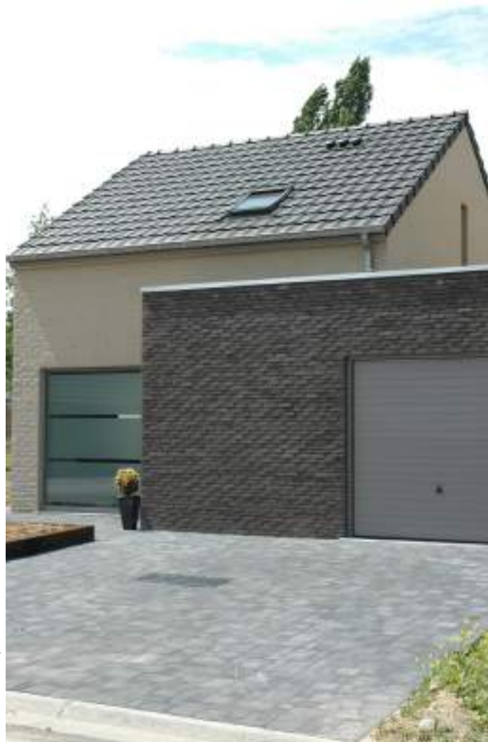
Kleur Leikleur op bruine scherf