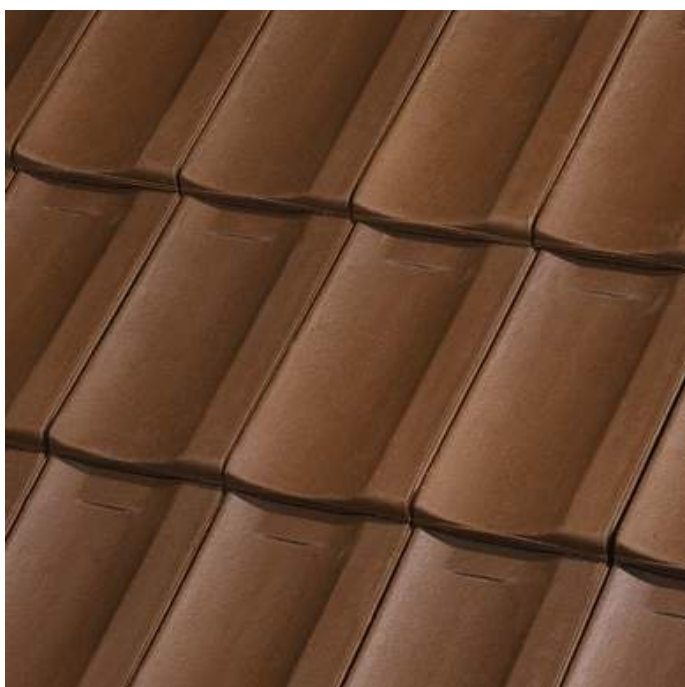
Bruin in de massa