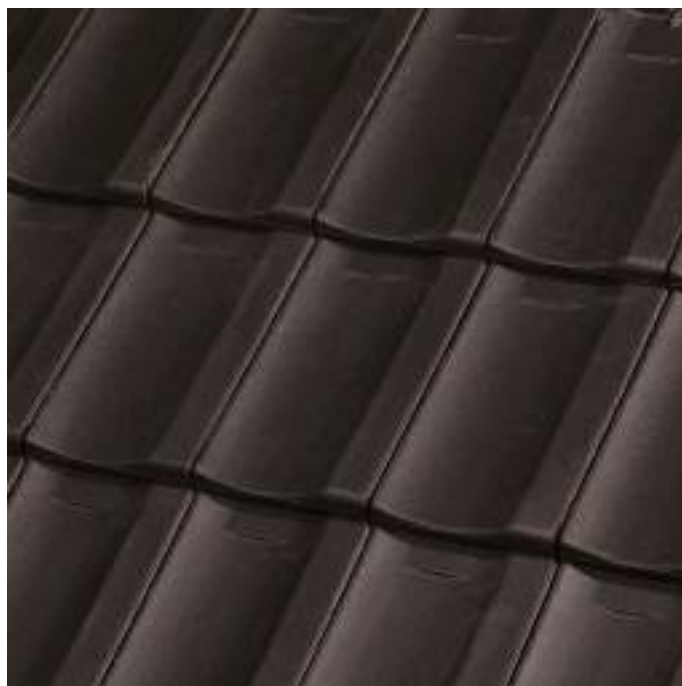
Leikleur op bruine scherf