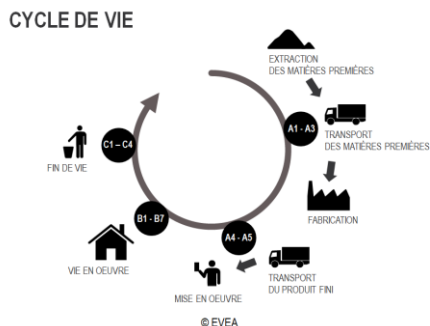
Diagramme de cycle de vie du produit :