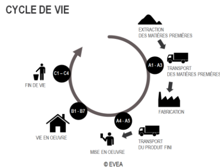
Diagramme de cycle de vie du produit :