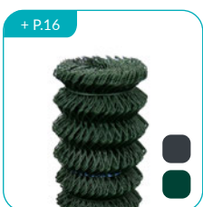
Simple torsion PLASTIFIÉ