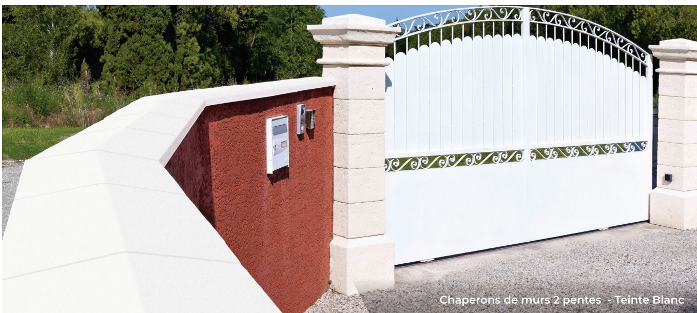
Chaperons de murs 2 pentes - Teinte Blanc