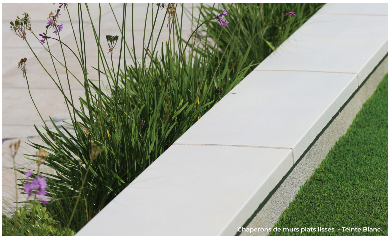
Chaperons de murs plats lisses - Teinte Blanc

Les chaperons plats sont également dotés d'une légère arête centrale de 1 mm, facilitant l'évacuation de l'eau. Le chaperon pressé à bords droits, d'une longueur d'un mètre, assure une finition sobre et soignée des murs, tandis que les modèles Vieillis et Manoir, avec leur finition travaillée unique, apportent une touche d'authenticité.