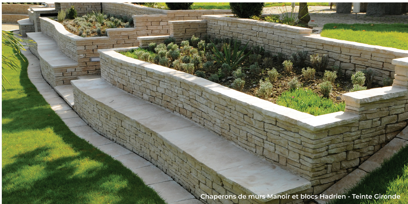
Chaperons de murs Manoïr et blocs Hadrien - Teinte Gironde