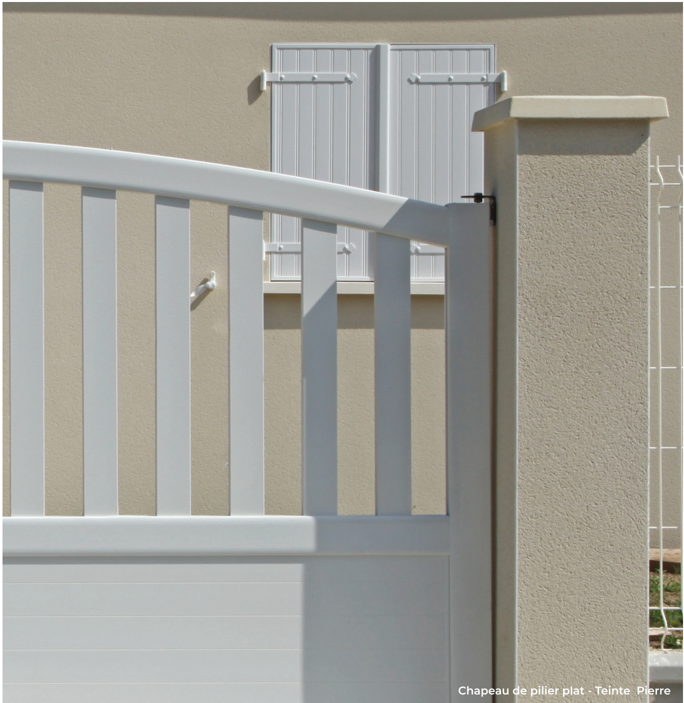
Chapeau de pilier plat - Teinte Pierre

Facile d'emploi et polyvalent, le bloc pilier en béton gris est conçu pour être enduit, offrant ainsi solidité et esthétique à vos clôtures. Sa structure simple permet une finition personnalisée, adaptée à vos préférences et à l'ambiance de votre extérieur.