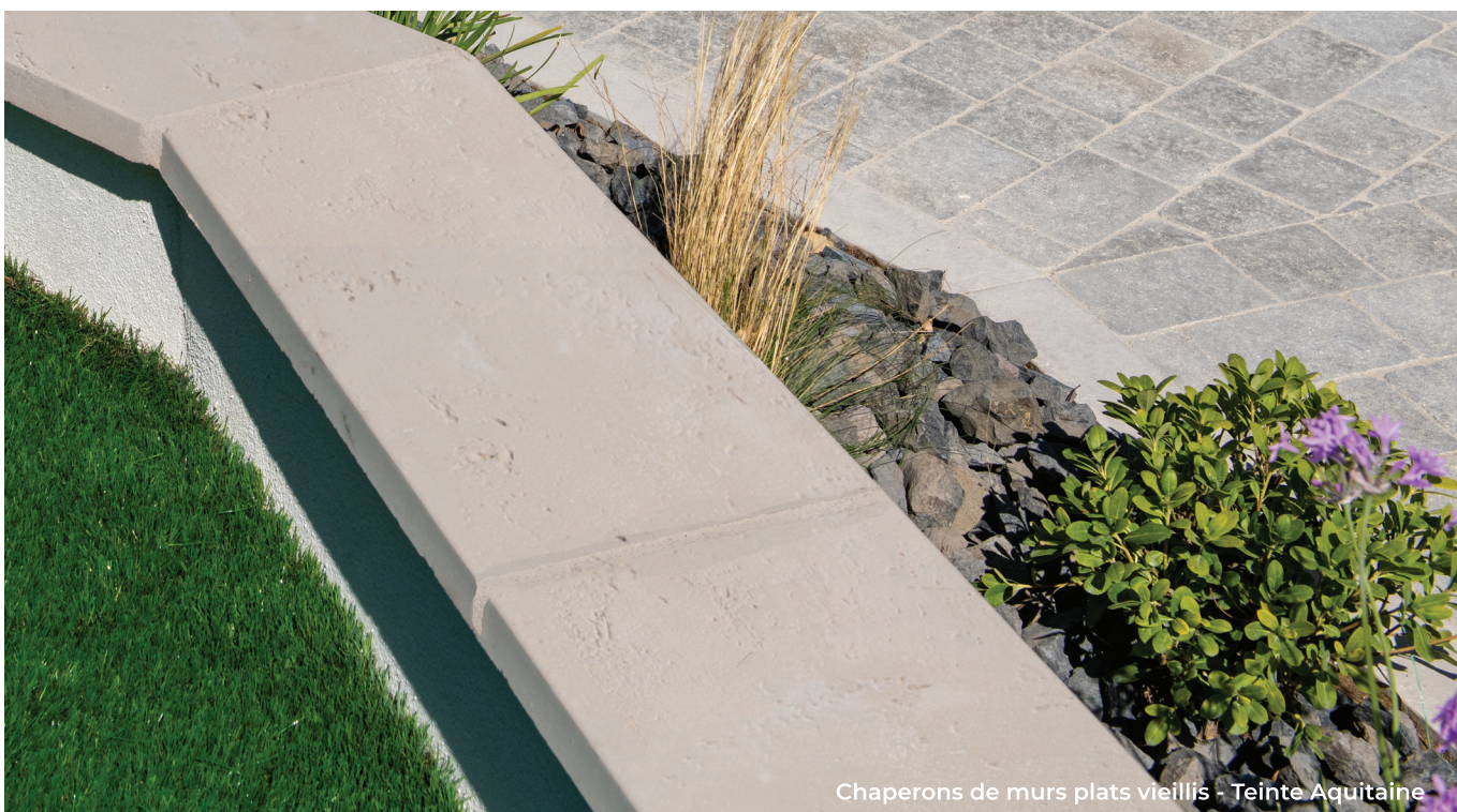
Chaperons de murs plats vieilliss - Teinte Aquitaine