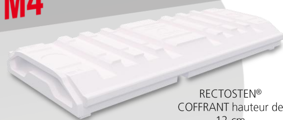
RECTOSTEN® COFFRANT hauteur de 12 cm