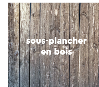
sous-plancher en bois

Laissez sécher suffisamment le nouveau béton. L'humidité contenue dans le sous-plancher doit être inférieure à 75% HR à 20°C minimum. Ne dépassez pas un taux d'humidité maximum de 2% CM pour le ciment et de 0,5% pour les chapes anhydrites. En cas de chauffage par le sol, le taux d'humidité doit être inférieur à 1,8% CM et à 0,3% CM pour les chapes anhydrites. Prenez toujours note des données relatives au taux d'humidité et conservez-les.