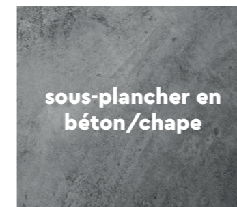
sous-plancher en béton/chape