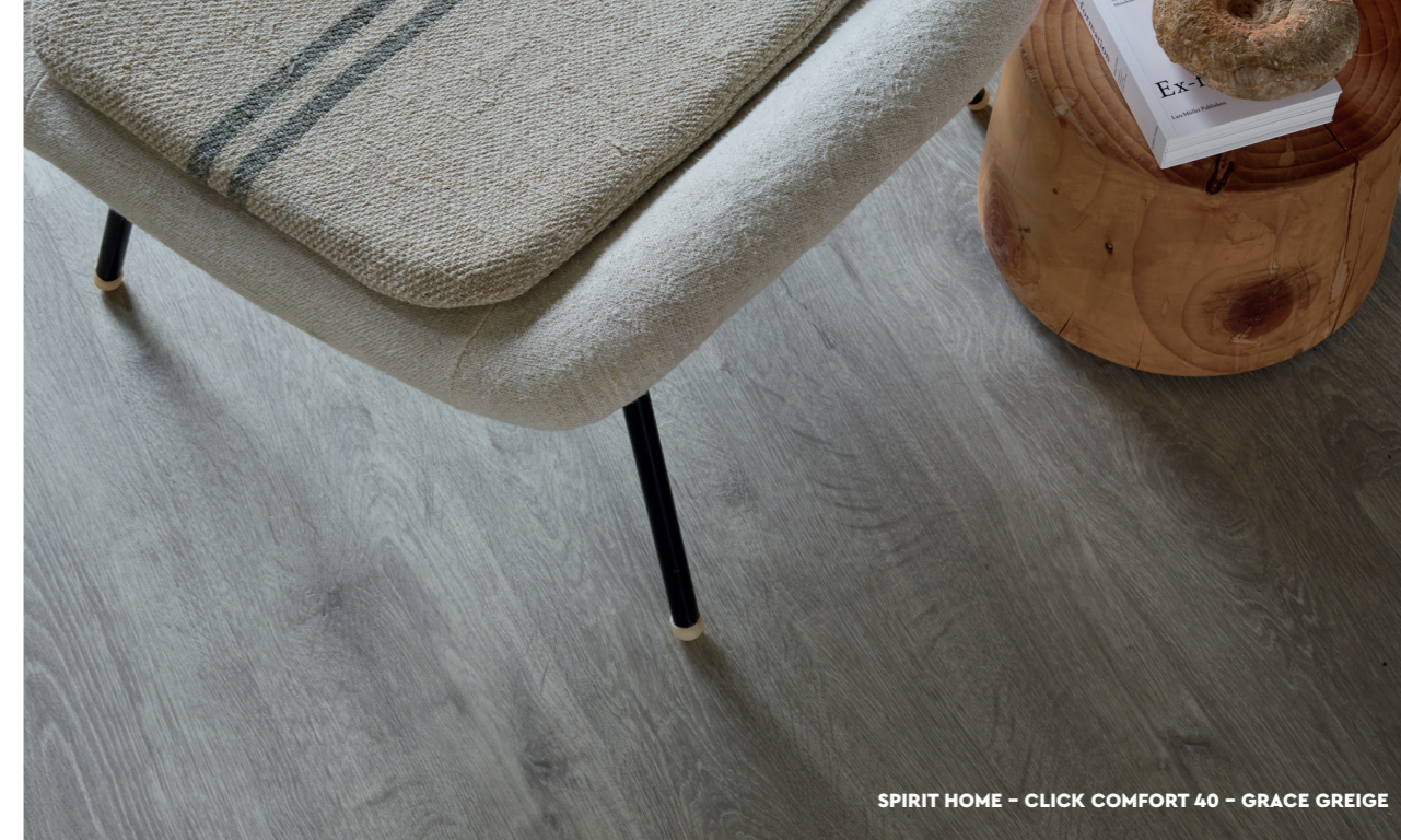
SPIRIT HOME - CLICK COMFORT 40 - GRACE GREIGE