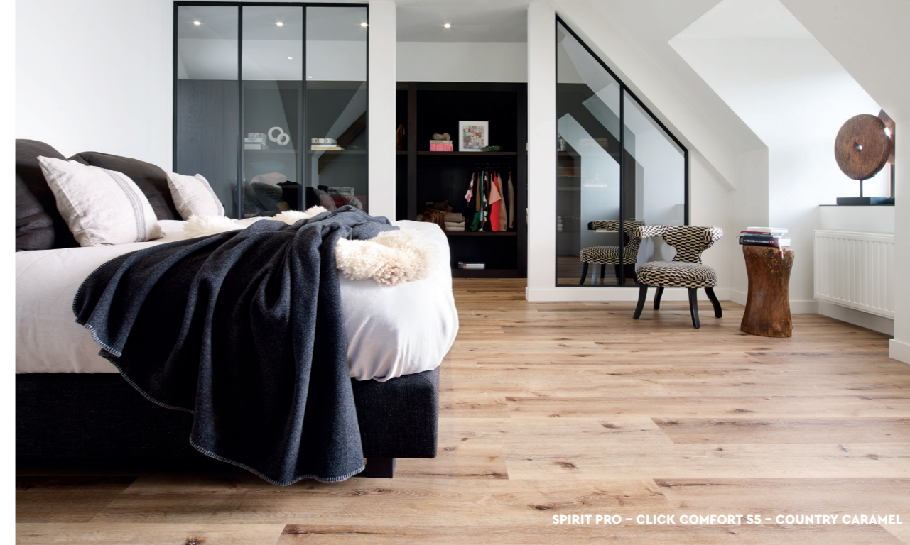
SPIRIT PRO – CLICK COMFORT 55 – COUNTRY CARAMEL