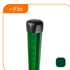
+ P.56 Poteau DOVIGRAF