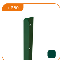
+ P.50 Poteau TÉ