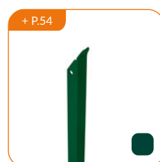
+ P.54 Jambe de force L