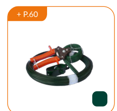
+ P.60 Accessoires de pose