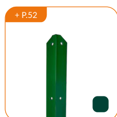
+ P.52 Cornière L