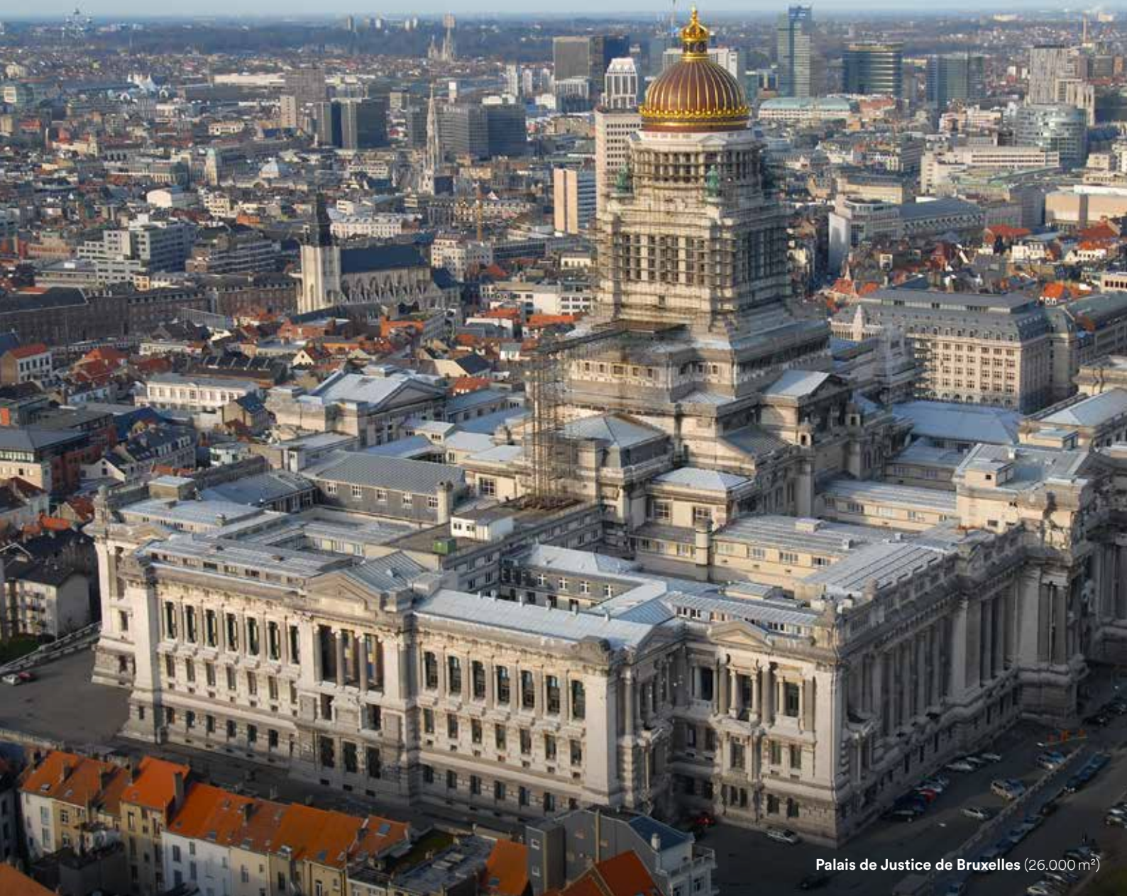
Palais de Justice de Bruxelles (26.000 m 2 )