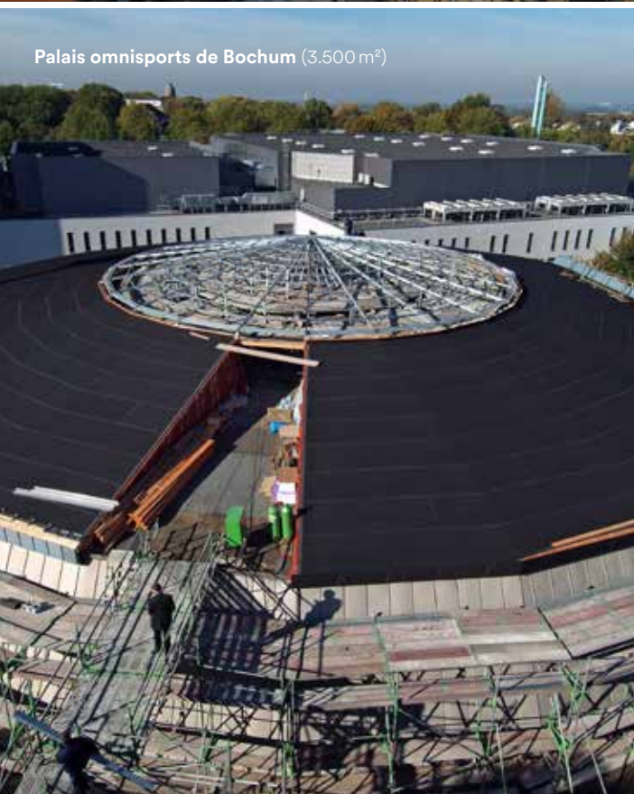
Palais omnisports de Bochum (3.500 m 2 )