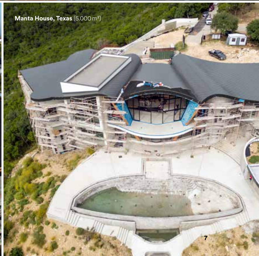
Manta House, Texas (5.000 m 2 )